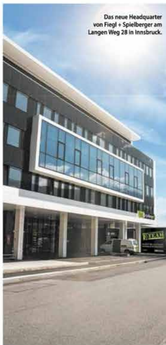
Das neue Headquarter von Fiegl + Spielberger am Langer Weg 28 in Innsbruck.

fiegl + spielberger GmbH Langer Weg 28 6020 Innsbruck Tel: 0512 / 33 33-0 Fax: 0512 / 33 33-37 info@fiegl.co.at Geschäftszeiten: Montag – Donnerstag von 7.30 bis 12 Uhr und von 13 bis 17 Uhr Freitag: 7.30 bis 12 Uhr